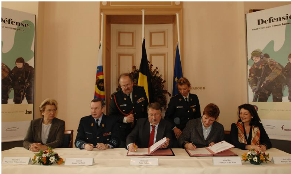
Minister van Defensie André Flahaut (PS) ondertekent met Francy Van der Wildt een charter voor gelijke kansen voor vrouwen en mannen in het Belgische leger (2007)