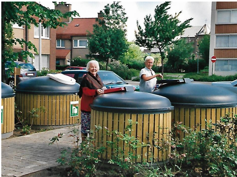
Buurtbewoners proberen de nieuwe MOLOK-containers aan de Populierenlaan uit