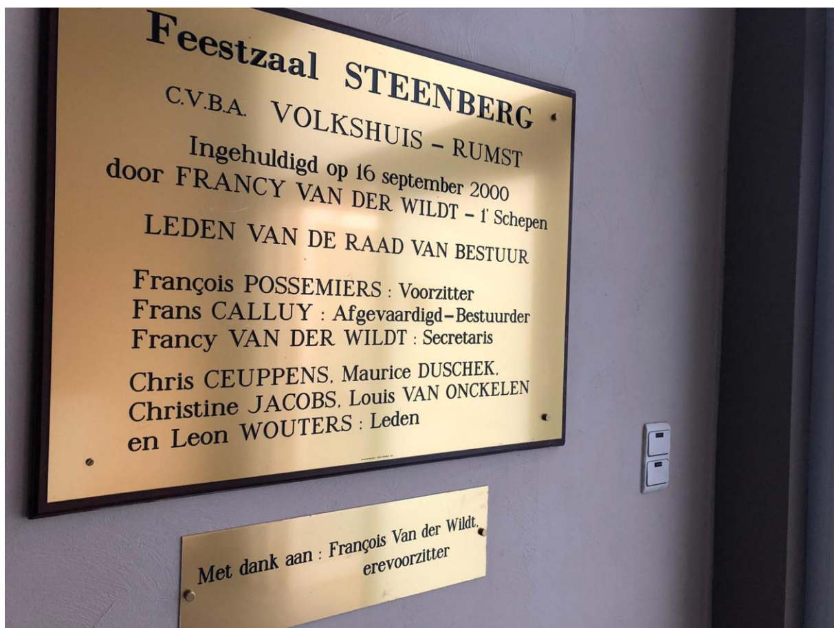
Herdenkingsplaket uit 2000

In Reet vond de socialistische beweging ooit een stek in café De Sportvriend in de Molenstraat, daarna in een lokaal van de socialistische mutualiteit in de Rumstsestraat terwijl de eigenlijke werking er vooral een plaats vond in de wijk Predikherenvelden.