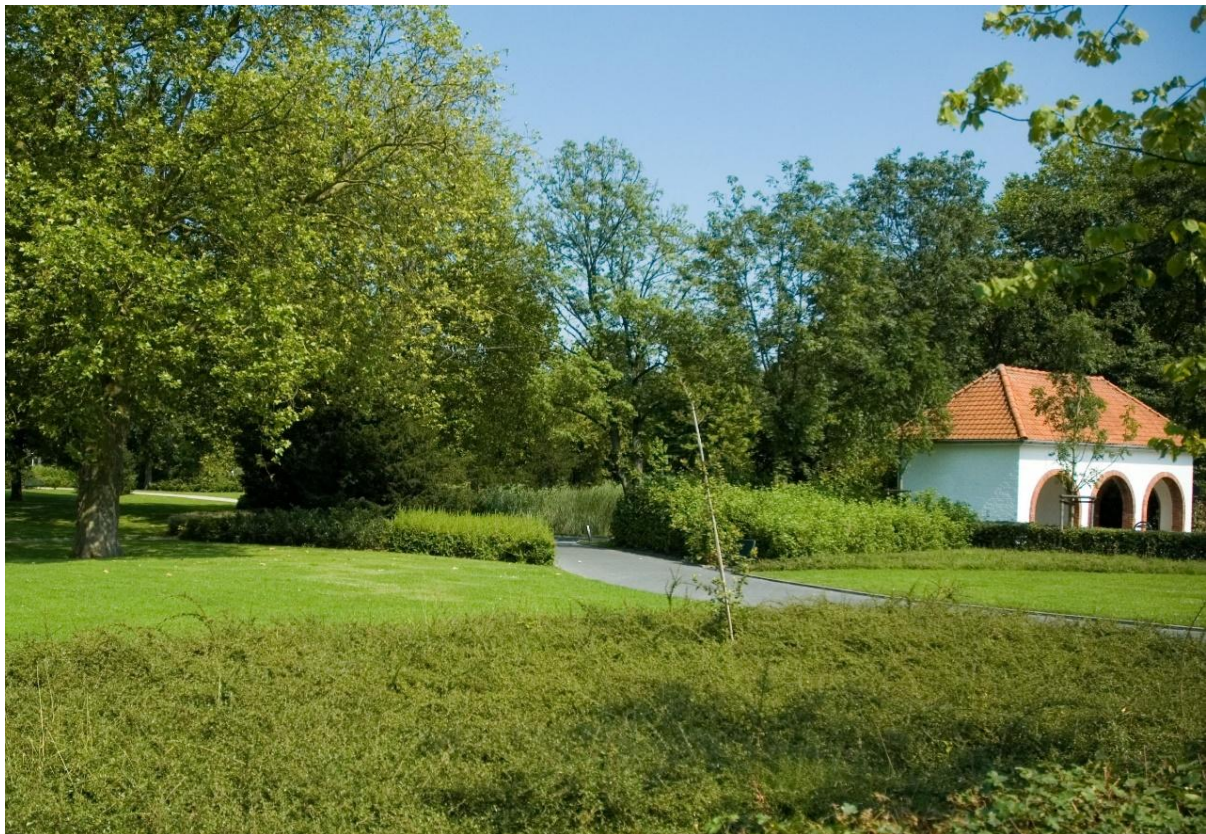
Park 's-Herenbeemden aan de oevers van de Nete, volledig gerenoveerd in 2009