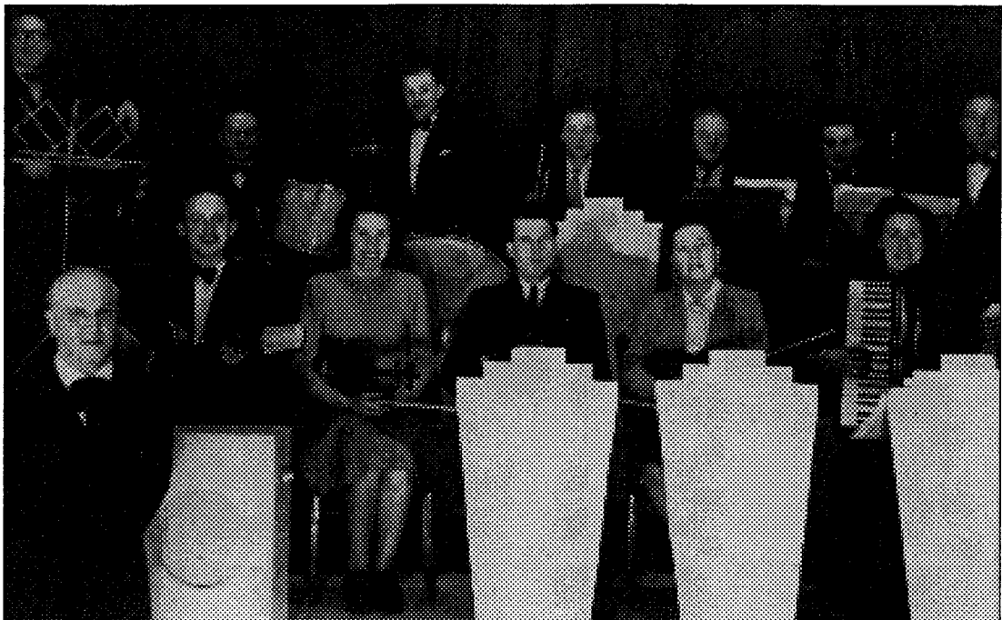
Symphonie orkest Peter Benoit