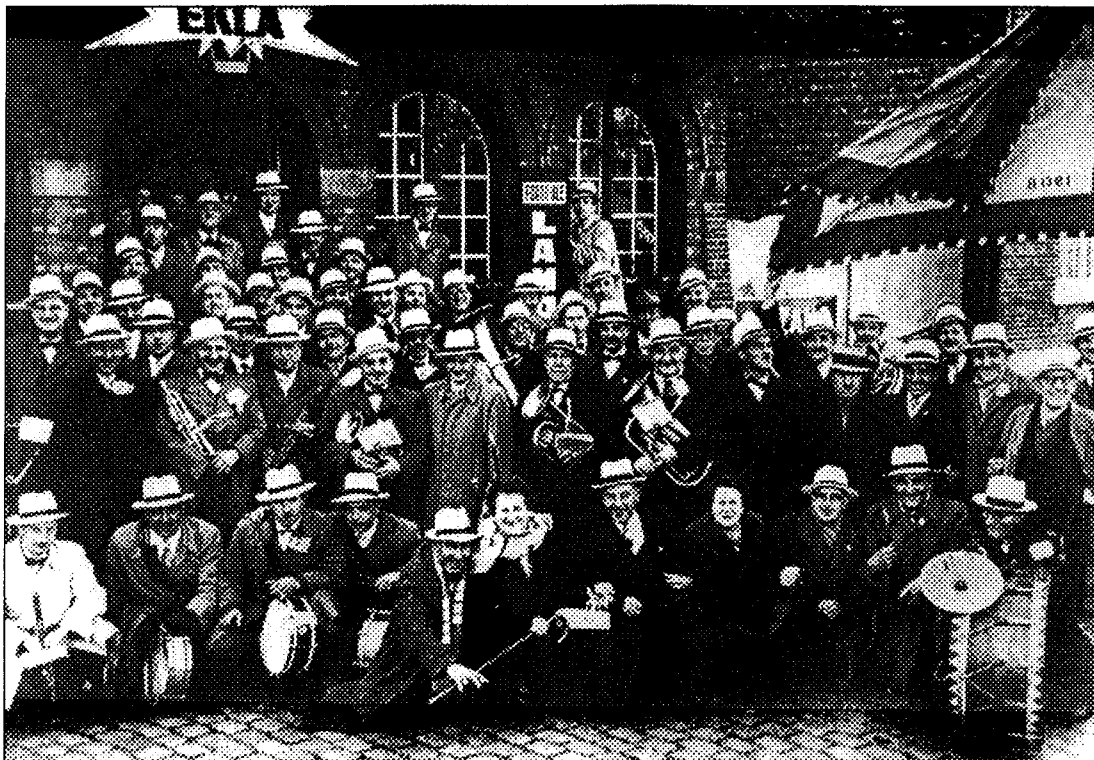
Een groep muzikanten voor café Peter Benoit