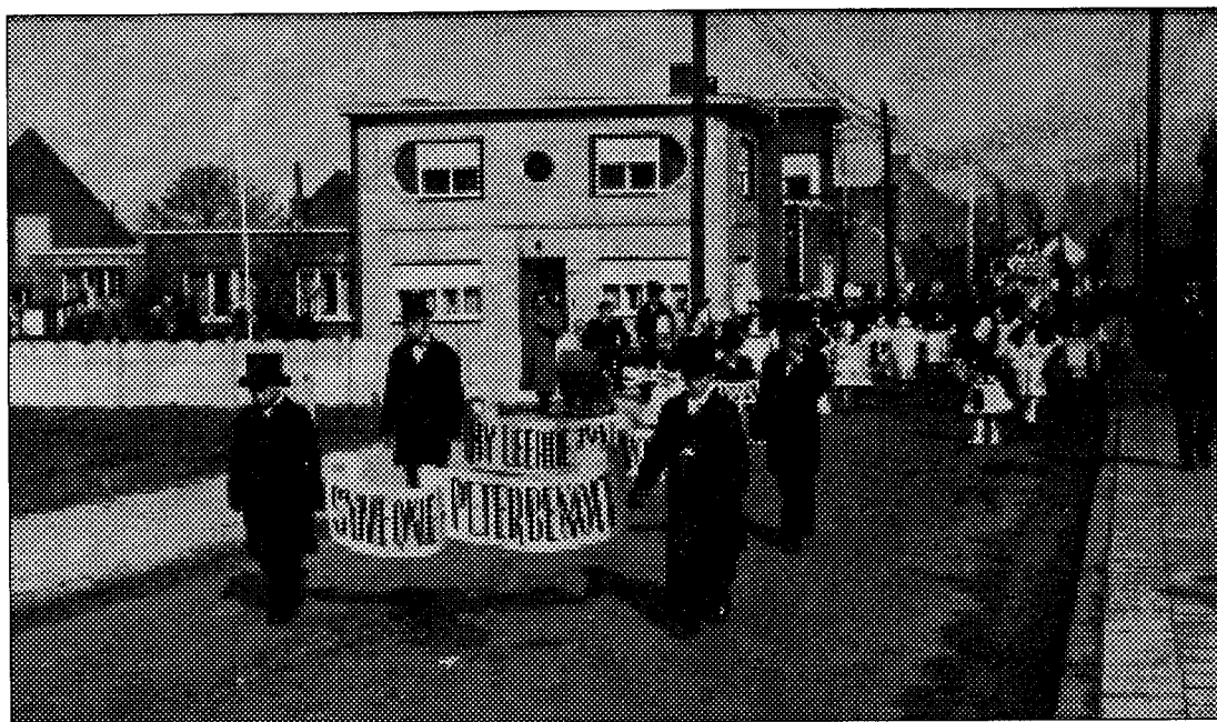
Camaval te Wijnegem