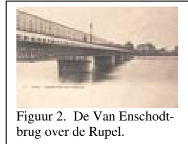
Figuur 2. De Van Entschotbrug over de Rupel.