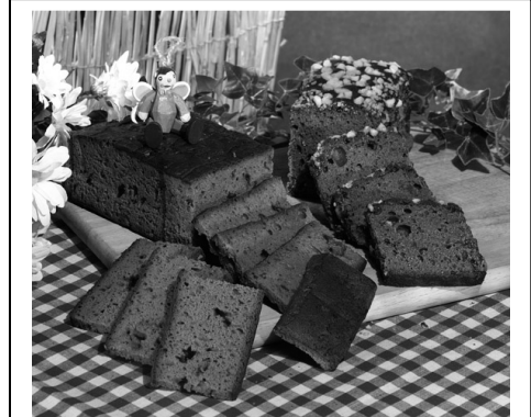
Figuur 8. Pontekoek of peperkoek.

Anna kreeg 's morgens een boterham met een stukje vlees, pontekoek (zie figuur 8) of kaas, omzeggens wat ze graag had. 's Middags werd er steeds een driegangenmenu bereid bestaande uit soep, aardappelen met groenten en vlees gevolgd door een dessert. Moeder maakte het eten klaar. Gedurende 2 à 3 jaar is er een inwonende meid geweest, Rosalie De Hertog uit Terhagen. Het vlees werd bewaard in een vliegencast in de goede, droge en koele kelder. Een vliegencast was een open kast met gaas ertegen.