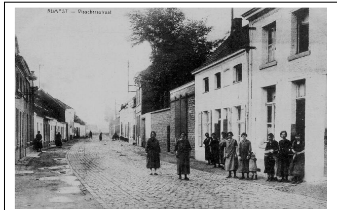
Figuur 3. De Vissersstraat.

Het arbeidershuisje van Yvonne in de Steenberghoekstaat had gelijkvloers maar één plaats: de woonplaats. Er stond een kleerkast, een kastje met een radio op, een Leuvense stoof, een tafel en stoelen. Meer niet, anders kon je er niet met 5 kinderen leven. Men vertoefde meestal daar of was buiten om te spelen. Boven de kelder bevond er zich een opkamertje waar een broer sliep. Op de verdieping waren er 2 kamers onder het dak. "Maar het was schoon afgemaakt, er zat een plafond in, je zag niet dat het onder het dak