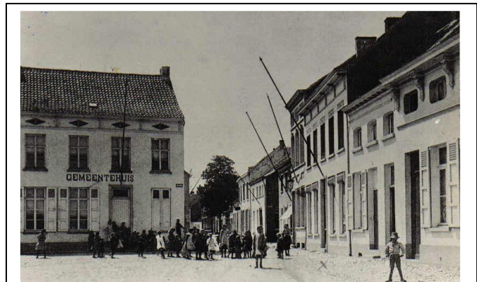
Figuur 4. Het gemeentehuis op de markt te Rumst. Het hoge huis naast de brede woning op de voorgrond is huize Tobback.

Het welgestelde gezin Tobback woonde op de Markt, naast de huidige bibliotheek aan de kant van de Veerstraat (zie figuur 4). Men huurde het huis van mevrouw Somers uit Terhagen. Geen onbekende, want de man, meneer De Beukelaer, was net als vader steenbakker. Gelijkvloers bevond zich de gang, een eerste plaats, een tweede plaats, een living en een keukentje. Op de eerste verdieping waren 3 slaapkamers en op de tweede vooraan een mansarde, met 2 kleine venstertjes, en