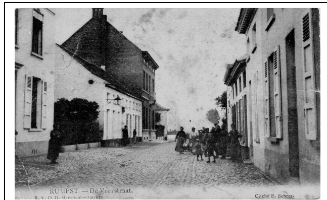
Figuur 5. De Veerstraat.

De Veerstraat (zie figuur 5) was een kasseiweg, later is er een trottoir aangelegd in dals . Het beeld van Onze-Lieve-Vrouw aan de lindeboom kreeg in de meimaand extra aandacht: steenbakker Egied Verbruggen, die twee huizen voorbij Frans woonde, ging in die maand elke dag de kaars aansteken. Verbruggens huis was er een met trappen op en met een kelderkeuken. De vader van Medard heeft