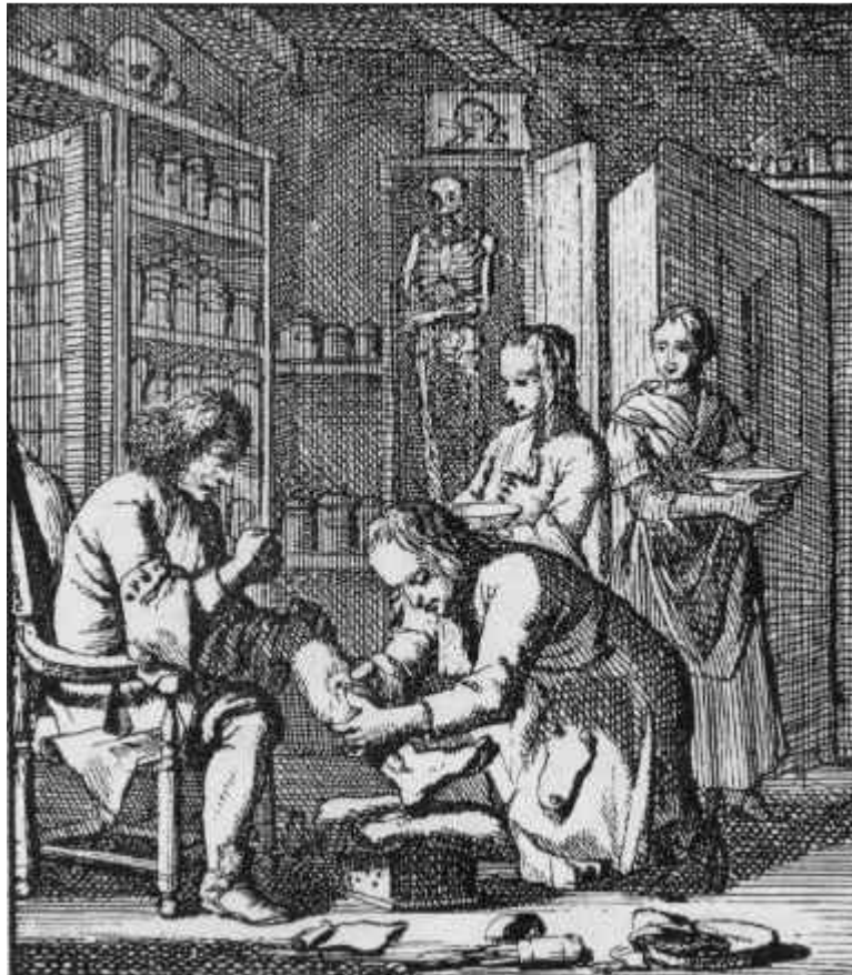
Figuur 1. Chirurgijn aan het werk in zijn paraktijkruimte.