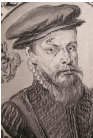
Figuur 2: Melchior Schetz

Hij werd geboren omstreeks 1516, misschien in Antwerpen, als tweede zoon van Erasmus Schetz en Ida Van Rentergem. In 1531 was hij ingeschreven aan de Universiteit van Leuven, waar hij