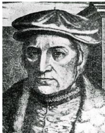
Figuur 1: Erasmus Schetz

Het Land van Rumst met inbegrip van Hingene (ressortierend onder Rumst), maar ook het land van Hingene (ressortierend onder Bornem), dat hij ook na een proces verkrijgt, werden verkocht aan Melchior-Nicolaas Schetz, een Antwerps koopman.