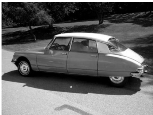
Figuur 3. Citroën DS.