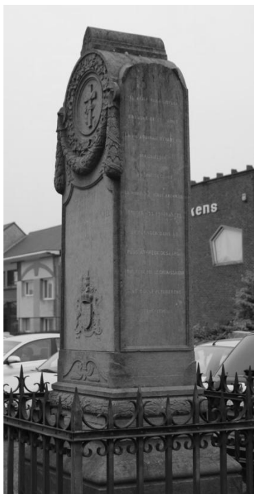
Het actuele monument vóór de parking van Van Reeth - Hoefkens

Dat wil zeker niet zeggen dat alle vragen zijn opgelost. Zo blijven er vragen rond het smeedwerk dat het monument afschermt. Een oude foto 1 , die kort na de oprichting van het monument moet zijn gemaakt (is het misschien de foto die Salu liet maken ?) toont het monument met smeedwerk, terwijl latere foto's het zonder smeedwerk tonen 2 . Vandaag is er opnieuw een hek rond het monument, maar dat is kennelijk niet het hek dat op de hierboven genoemde foto afgebeeld is.