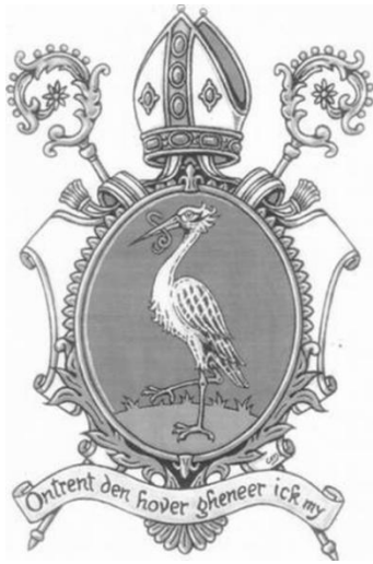
Wapenschild van de Sint-Bernardusabdij