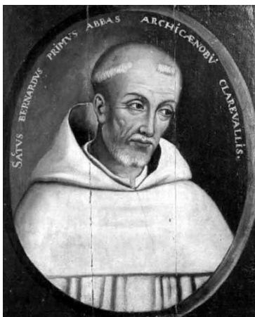
Bernardus van Clairvaux

toegelaten. Ook in 1140 was er niets te zien: leuningloze stenen zitbanken, een blokaltaar, ijzeren kandelaars, een lessenaar voor de lezingen (de psalmen kenden ze uit het hoofd). Geen enkel beeld, geen fresco's; alleen een houten altaarkruis. Geen vloerkleden, geen kroonluchters, geen kleurige gewaden, geen zijde, geen goud, geen zilver, zelfs geen koper of messing, de enige luxe waren kleurloze raampjes met een loodpatroon in abstracte figuren. De kerk was tevens de enige beglaasde ruimte in heel het abdijcomplex; overal elders, in de kruisgang, de slaapzaal, de refter, de werkplaatsen, tochtte het als er wind stond. De Cisterciënzers verafschuwden alle luxe, de luxe die hun grote man Bernardus van Clairvaux, de ongemakkelijke woordtovenaars, die een zo smeltende charmeur kon zijn als hij wilde, verweet aan het eerste klooster der toenmalige christenheid, het majestueuze Cluny in Bourgondië.