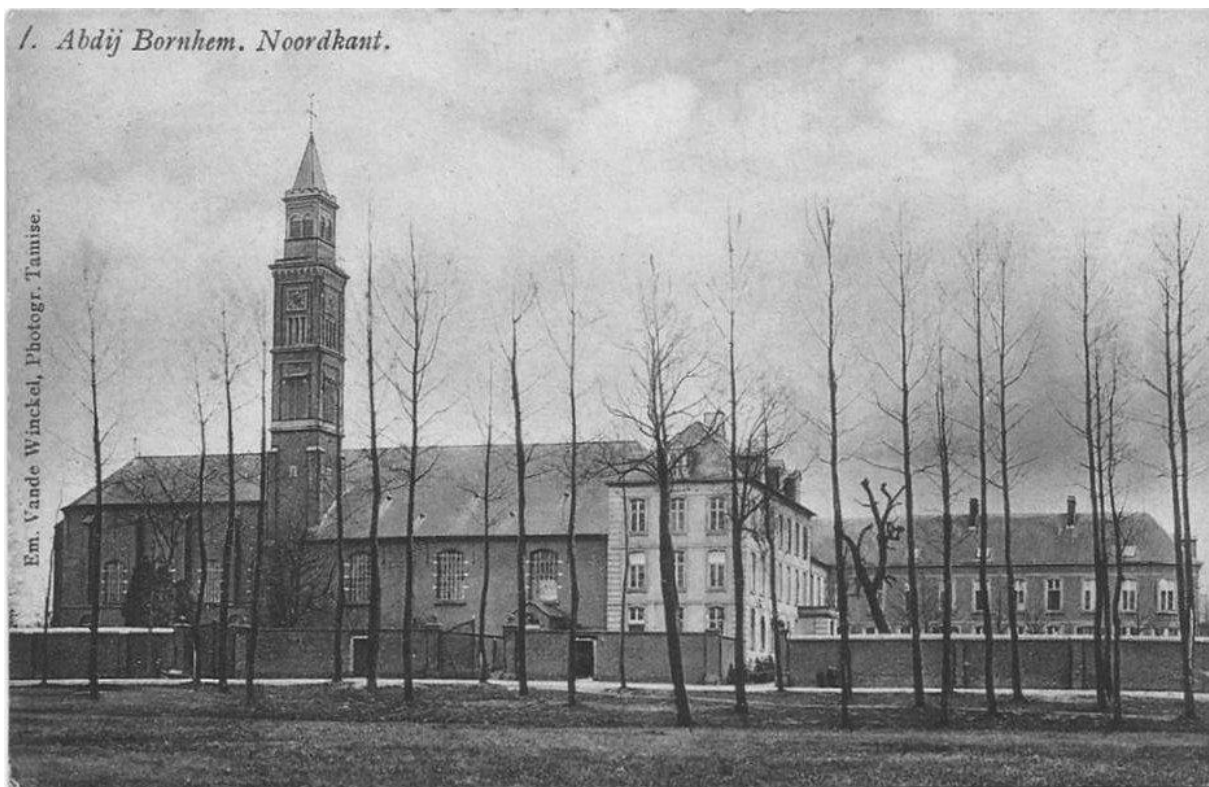
De abdij van Bornem

inventaris, werd voltooid in 1890. De inventaris omvatte toen 15.237 banden. In de bibliotheek van de abdij staat zowat alles bij elkaar wat ooit sinds de middeleeuwen door Cisterciënzermonniken in alle landen op papier is gezet, in indrukwekkende rijen zwart-witte banden, de kleuren van het Cisterciënzerhabijt. Het is een collectie van geschiedschrijving, theologie en exegese, filosofie, spiritualiteit, meditatie, mystiek en heiligenlevens. Net zoals bijna elke kloosterbibliotheek beschikt deze van Bornem ook over een “enfer”, de hel, een streng afgesloten kast waar de nogal bedenkelijke boekwerken werden bewaard en waarvan alleen de abt een sleutel bezat. Monniken konden enkel met de toestemming van de abt en met een aanvaardbare reden de collectie in de “hel” raadplegen. Na de eerste inventarisatie begon Benedictus de archieven te bestuderen en maakte hij notities voor zijn later te verschijnen Obituarium. Hij publiceerde verder in internationale Cisterciënzerperiodieken zoals de Cisterciënzerchronik (Bregenz), waarin in 1896 zijn verhandeling over Idesbaldus van der Gracht verscheen: “Der Sel. Idesbald und seine Verherrlichung in Brugge” en in 1898