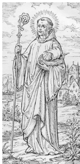
Idesbaldus van der Gracht

ambten en functies van eerste orde. Een tak van de familie van der Gracht bewoonde in een latere periode het kasteel Eeckhoven te Rumst. Vanaf 1155 was Idesbaldus twaalf jaar lang de derde abt van Ter Duinen als opvolger van de zalige Albero. Onder het bewind van Idesbaldus kwam de abdij tot grote bloei en voorspoed. Op 18 april 1167 overleed hij er. Idesbaldus werd op 23 juli 1894 door paus Leo XIII zalig verklaard, en is de patroon van de Vlaamse adel, de polderboeren, de vissers en de kustbewoners in het algemeen. Zijn naam leeft ook in het geslacht Van der Gracht. Dom Gedeon van der Gracht (Gent 1491 - abdij Cambron 1554) was Augustijner-eremiet en biechtvader van de gouvernante van onze Nederlanden, Maria van Hongarije. Gedeon werd in 1536 bisschop en in 1551 abt van de Cisterciënzerabdij van Cambron in Henegouwen, waar hij overleed in 1554. Voor de geïnteresseerden bezit Rumesta een genealogie Van der Gracht ter inzage, van de hand van wijlen Jules Reusens.