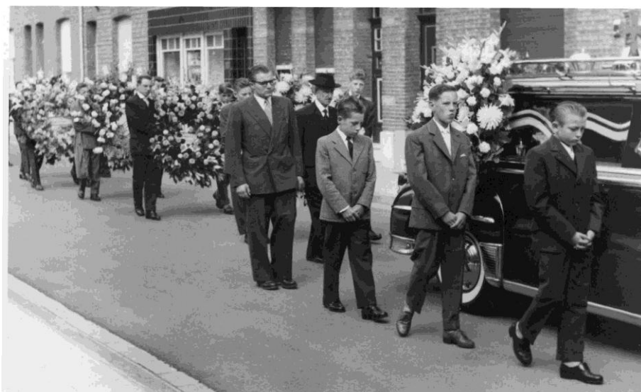
De begrafenis op zaterdag 20 juli werd door een grote massa bijgewoond