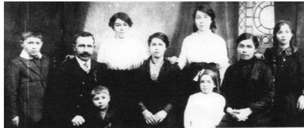
De familie in 1916