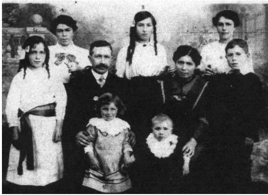
De familie in 1915