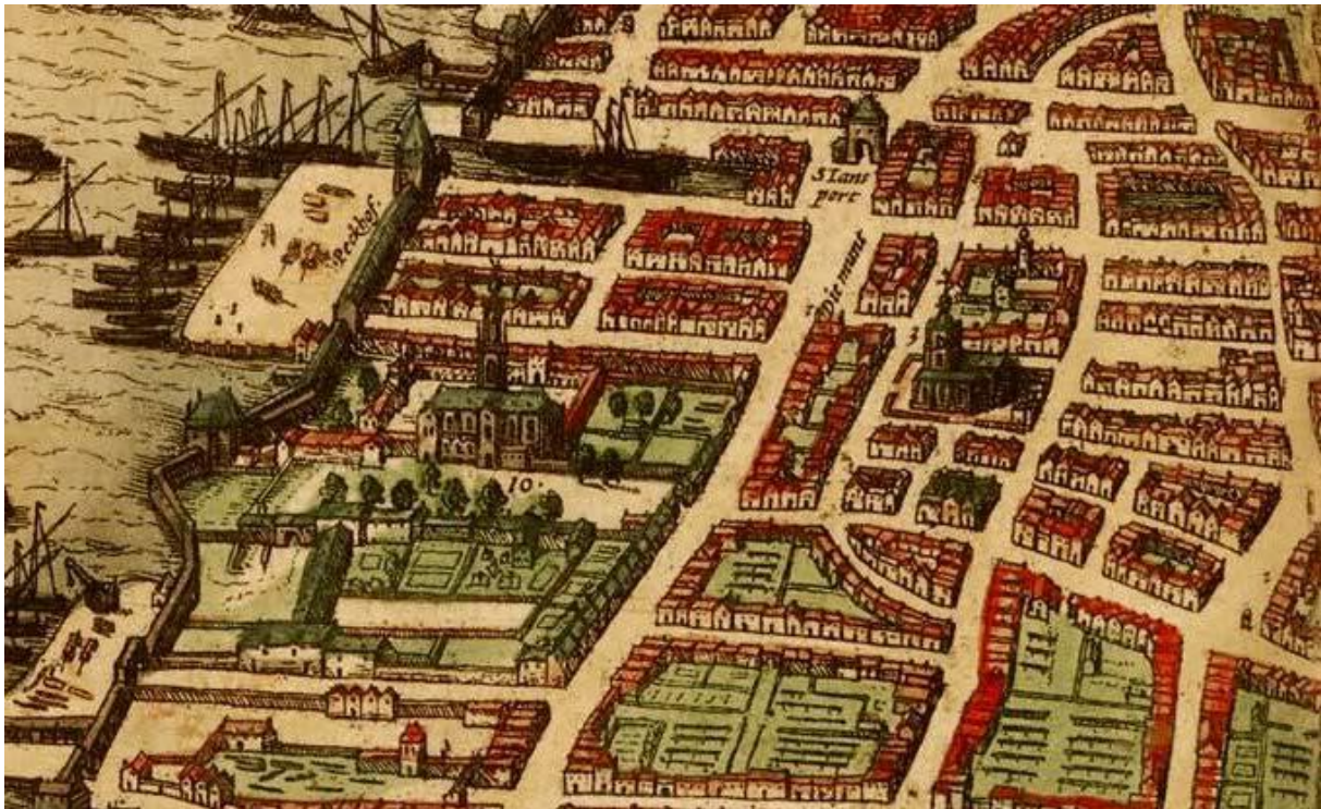
Situering van de Sint-Michielsabdij in Antwerpen (nr. 10 is de kerk van de abdij)

Enkele straatnamen als de Kloosterstraat en de Sint-Michielskade verwijzen nog naar deze prachtige abdij. Lang geleden was deze norbertijnenabdij, gesticht door de Heilige Norbertus in 1124, één van de machtigste abdijen in onze contreien.