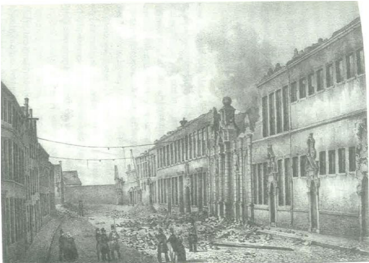
De ruïnes van het arsenaal na het bombardement op Antwerpen door de Nederlanders (lithografie door Jean-Louis Van Hemelryck, uit Evénements de la Belgique, 1831, Rijksmuseum Amsterdam)

In 1831 ontstonden in de stad schermutselingen tussen Belgische revolutionairen en Nederlandse troepen gelegerd in het voormalige Zuidkasteel (de Antwerpse citadel). Vanwege de militaire functie van de gebouwen van de vroegere abdij richtten de Nederlanders er hun artillerie op waarbij de laatste resten werden verwoest. Doorheen het abdiydomein werden na de teloorgang en afbraak van de gebouwen in de 19de eeuw straten getrokken.