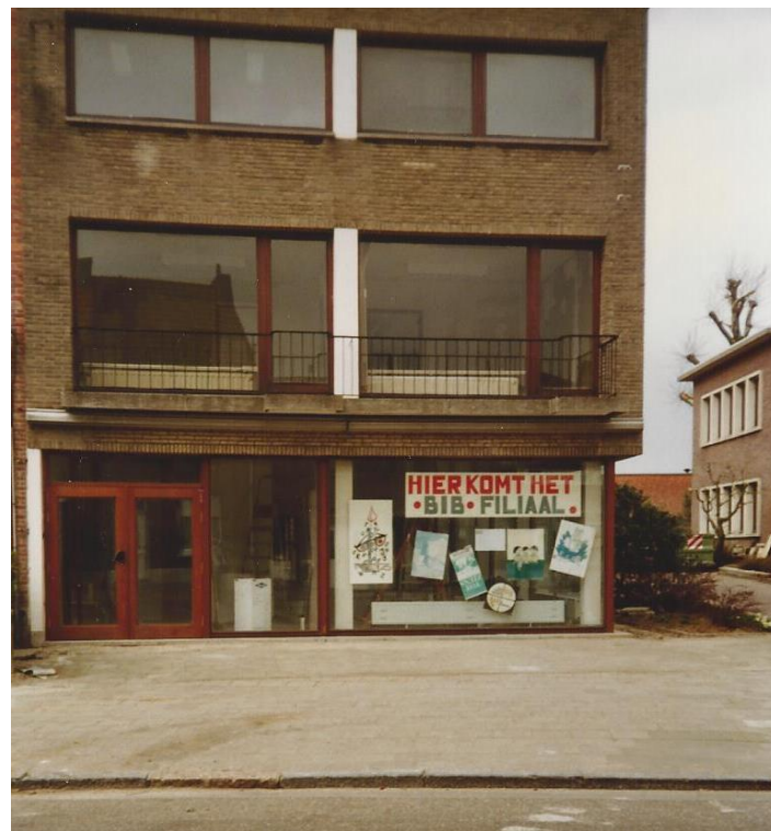
De nieuwe locatie voor een bibliotheek in Reet – centrum (1993)