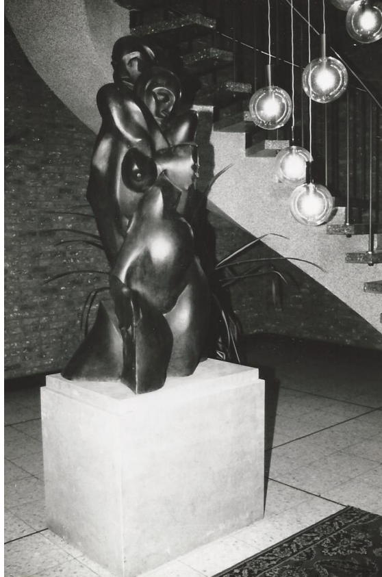
“Hij en Zij” van Lode Eyckermans