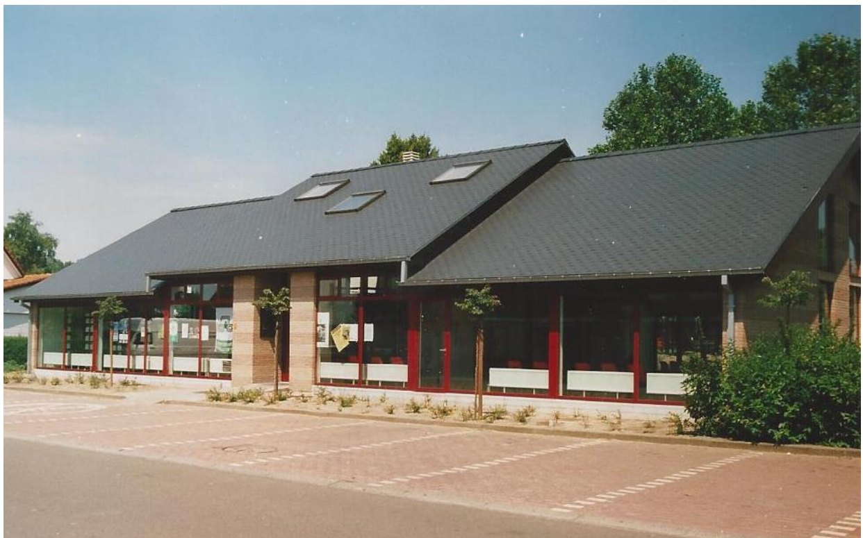
De nieuwe bib en cultuurzaal in de Predikherenvelden (1995)