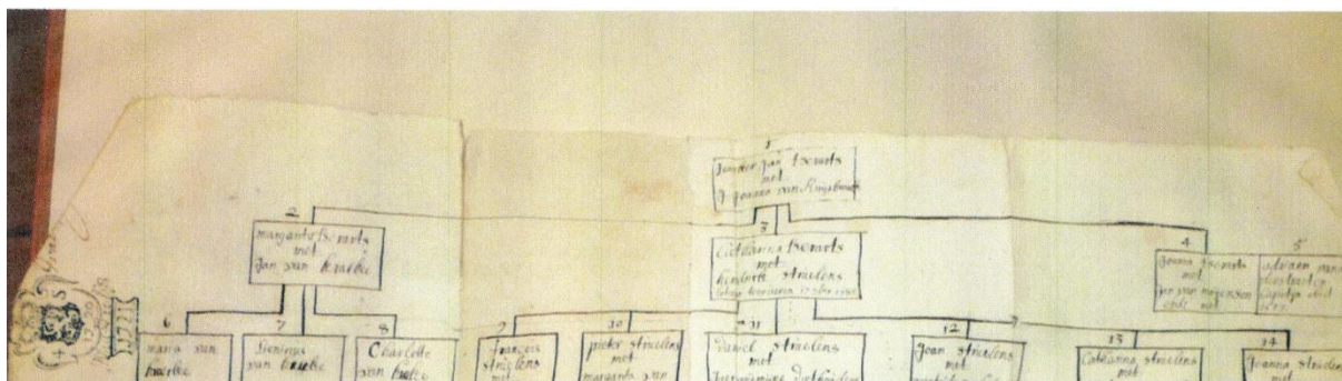
RA Anderlecht, Raad van Brabant, processen van de clerus, inv 77, nr 1214 extract uit een dossier voor de Raad van Brabant (stamboom Struelens)

Als U één van de familieleden Struelens tegenkomt in uw stamboom, dan is een bezoek aan de website van de meiseniersraad aan te bevelen. Ook op de website van Brusselse Geslachten vindt u meer informatie over de geschiedenis van de Brusselse patriciërs.