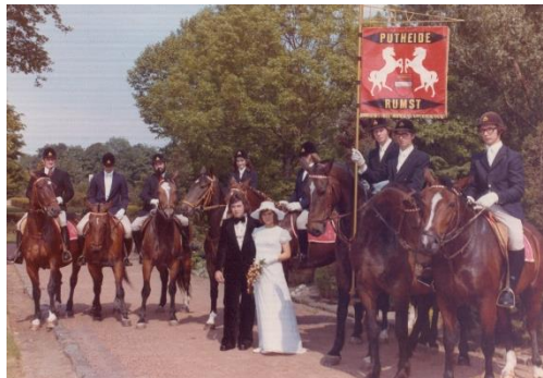
ABB waren ambtshalve werd het nieuwe maandblad voor jaren waren er ook goede 'Putheide', Rumst.