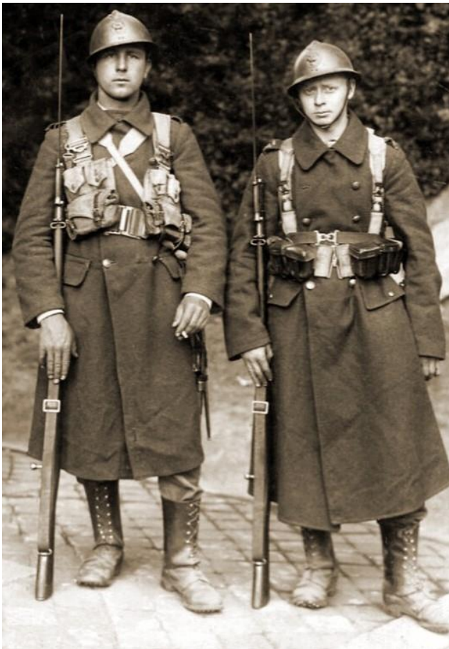
Belgische linie-infanteristen 1939

Het was de bedoeling om dit te herhalen voor de Tweede Wereldoorlog 1940-1945. De covid-crisis maakte echter dat de noodzakelijke archieven gesloten waren, verscheidene zelfs één jaar lang. Het was dus onmogelijk om de historische opzoekingen te doen in de desbetreffende archieven. Vanaf september 2021 zijn de militaire archieven te Evere opnieuw geopend, maar met heel wat covid-restricties. Je kan de dossiers raadplegen, maar strikt beperkt in de tijd, één uur met maximum één persoon en natuurlijk na afspraak, met een mondkapje. Individuele dossiers van militairen uit de twee wereldoorlogen kan je aanvragen bij de ondersectie Notariaat Defensie, gevestigd in Kwartier Koningin Elisabeth, tevens het hoofdkwartier van het Belgische leger te Evere.