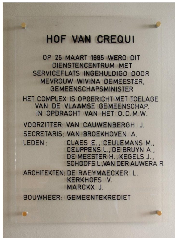
Herinneringsplaket in Hof van Crequi