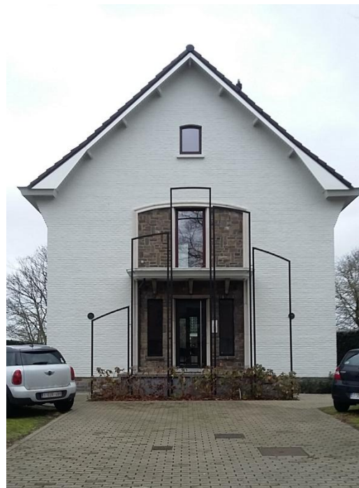
De bedrijfszetel van cvba Consensio (foto uit 2020)