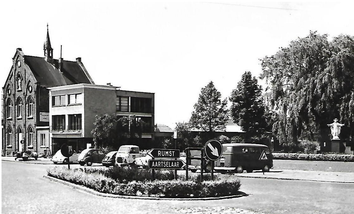
Winkel en woning Devrieze aan het Koningin Astridplein (foto uit 1964)