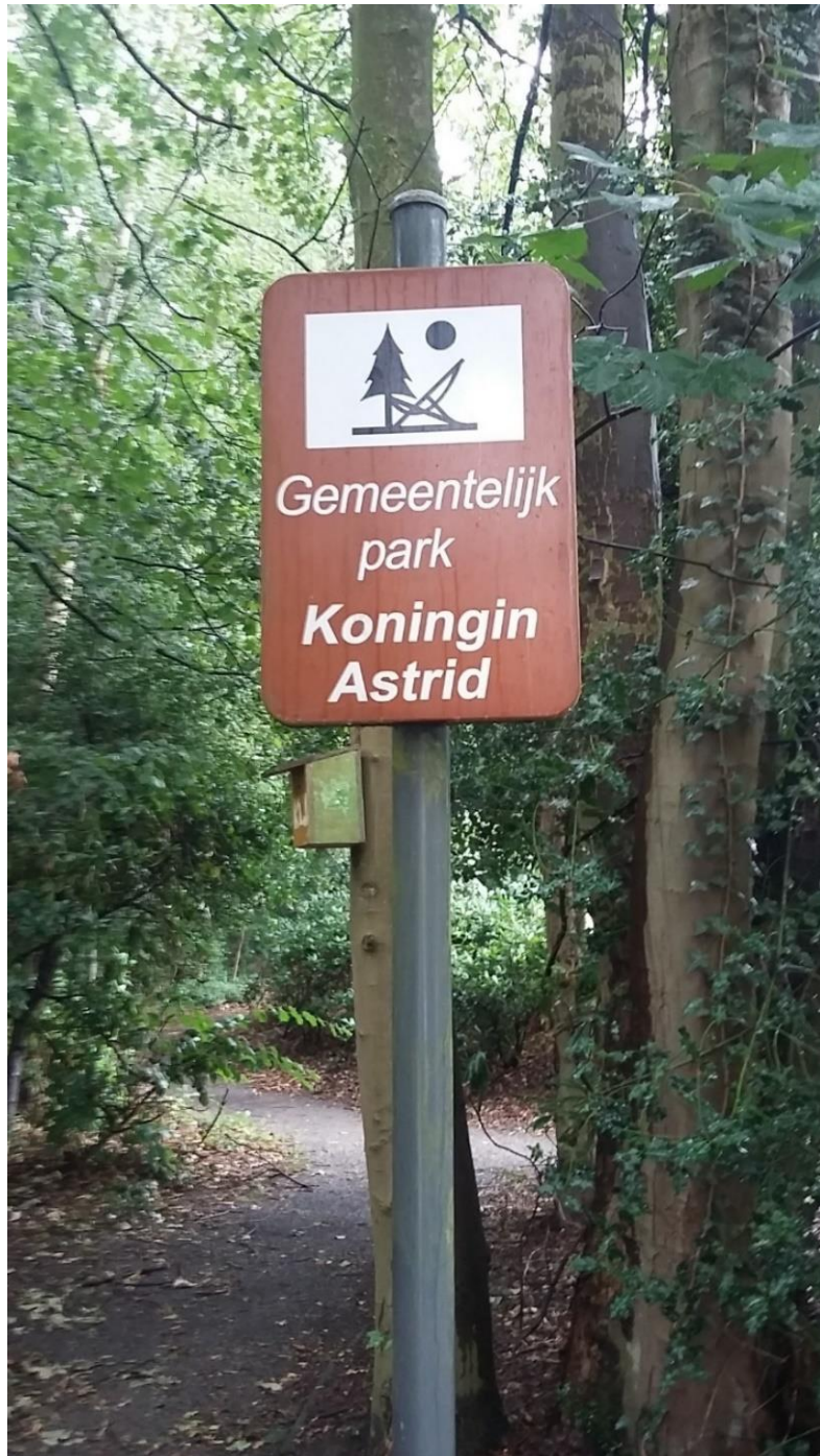
Koningin Astridpark aan de Laarstraat / Rumstsestraat in Reet