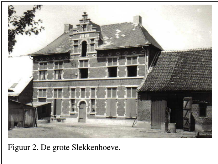
Figuur 2. De grote Slekkenhoeve.

De prins de Ligne, heer van Rumst in 1700, beval de afbraak tot in de grond. Zijn bevel werd gewetensvol opgevolgd 5 .