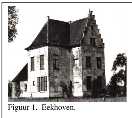
Figuur 1. Eekhoven.

"Eekhoven" behoorde rond 1700 toe aan de familie Van Rommerswael, gezegd Van der Gracht. De