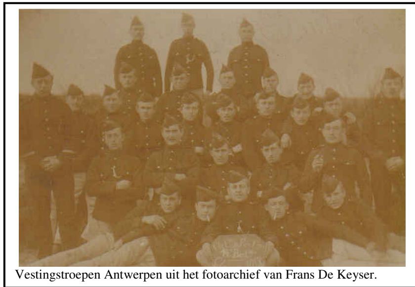
Vestingstroepen Antwerpen.

De bemanning van de schans van Dorpveld slaagde erin de vijand af te slaan maar hield nog maar één