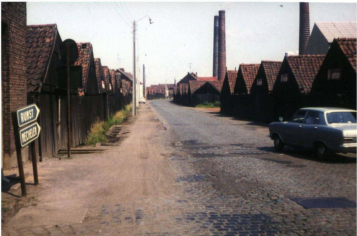
Een beeld van de Nieuwstraat, tussen Terhagen en Rumst, rond 1970